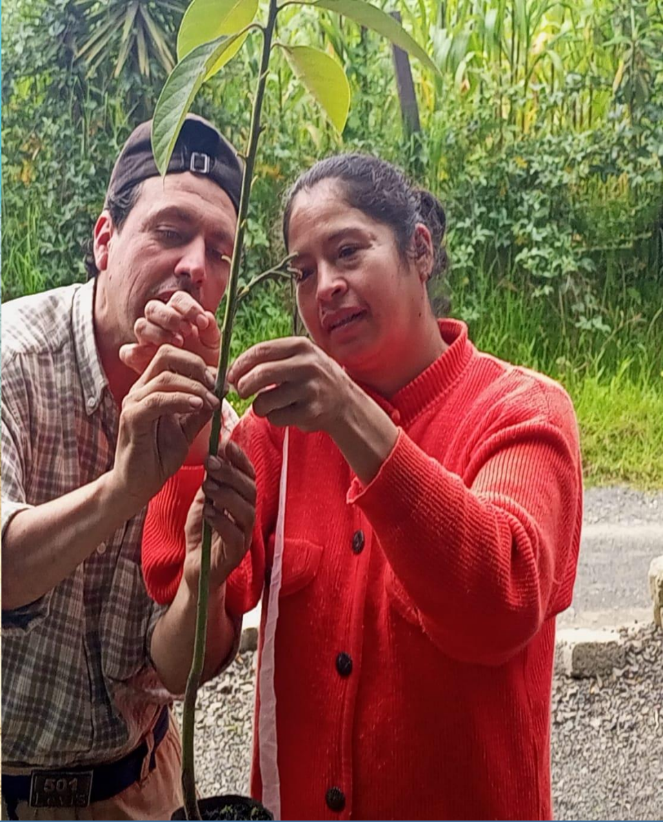
Taller de injerto de frutales