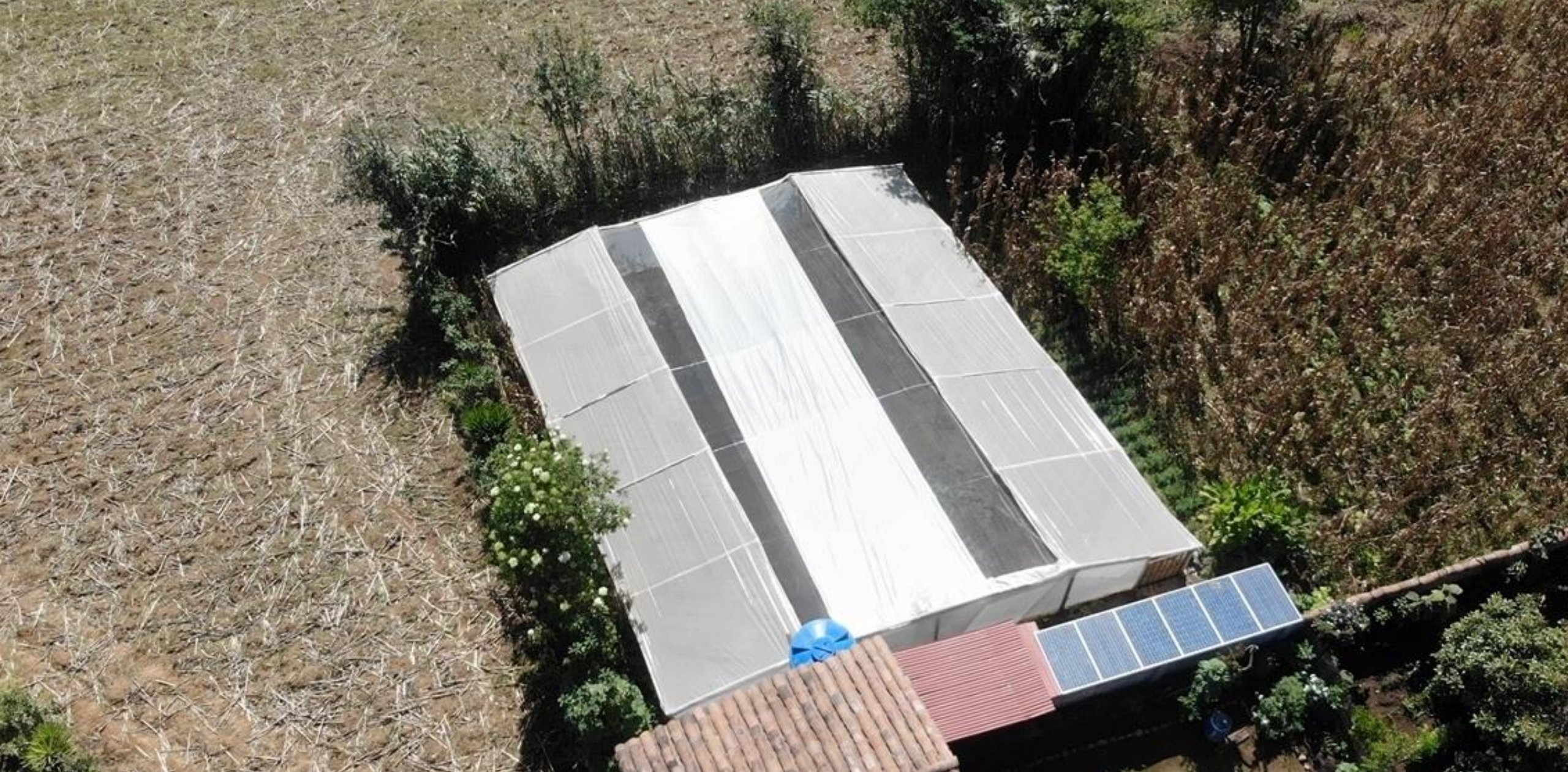
VIVERO - INVERNADERO/ UNIDAD PRODUCTIVA SAN VICENTE DE LA FUNDACIÓN KISHWAR - JUNIO 2023