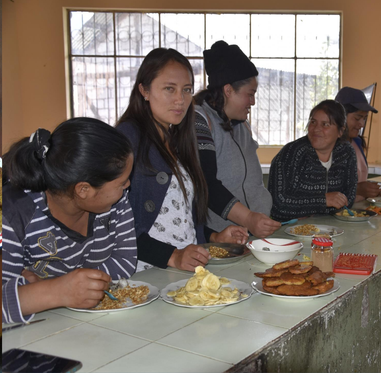
Talleres de cocina saludable con madres y padres de familia de las unidades educativas